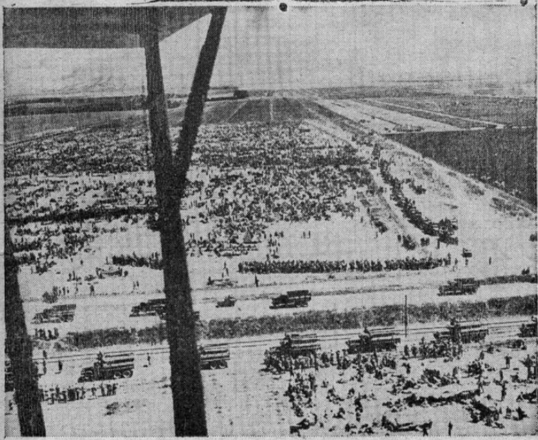
Vista aérea de un campamento de prisioneros alemanes e italianos capturados por las fuerzas aliadas durante la etapa final de la victoriosa campaña de Tenez.

La noticia es buena por que indica que la Compañía no había hecho una inversión tan alta sin el propósito de continuar con la exportación de balsa en gran escala. Esta exportación mejorará la situación de muchos pequeños finqueros que pueden cortar balsa y venderla a precios más o menos buenos dejando una utilidad apreciable. Cuando esta industria esté en pleno desarrollo y los agricultores aprendan a cortar y a acarrear esta madera, la utilidad será mayor y el beneficio para la provincia bastante apreciable.